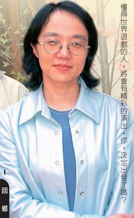
青輔會主委 林芳枝