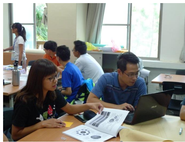
主持人帶動各組進行議題討論與方案研擬