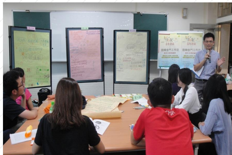
小組分享提案報告與老師總結